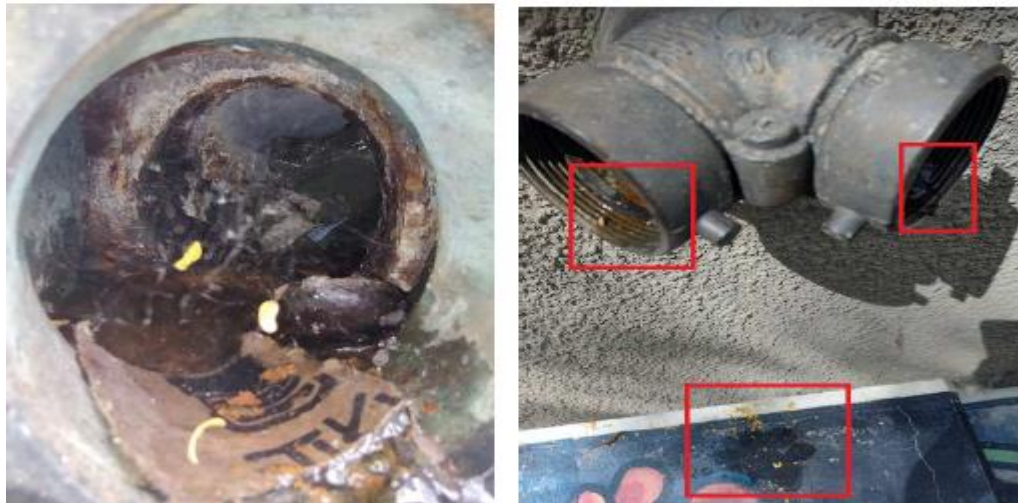
Ilustración 8 Acoples red contra incendio.