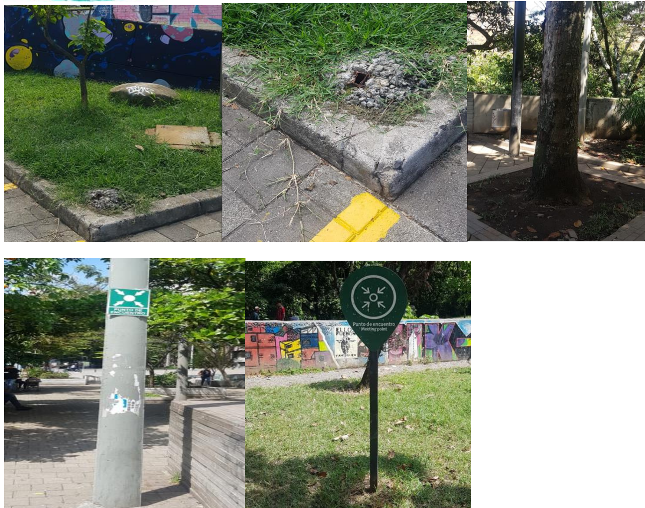
Ilustración 6 Puntos de encuentro.