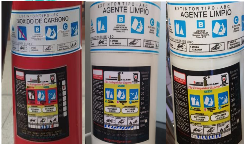
Ilustración 7 extintores.