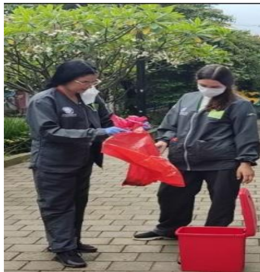
ILUSTRACIÓN 4 TRATAMIENTO CARACOLES AFRICANOS