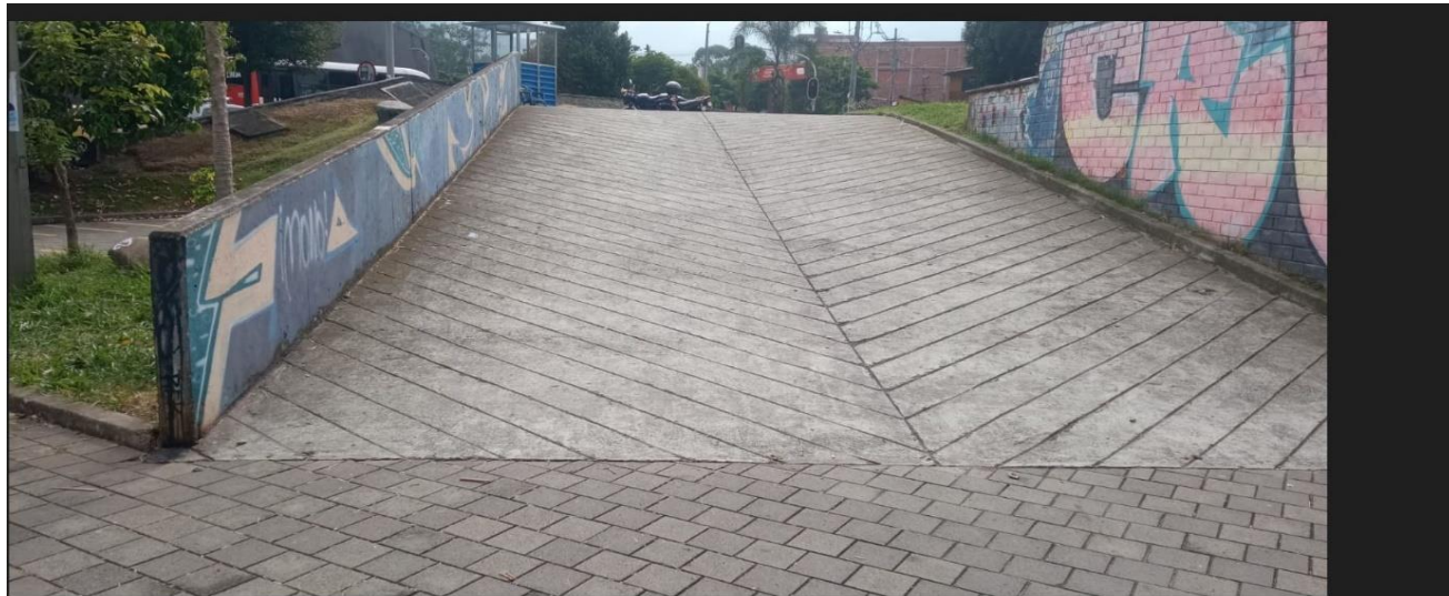
ilustración 3. Entrada parqueadero