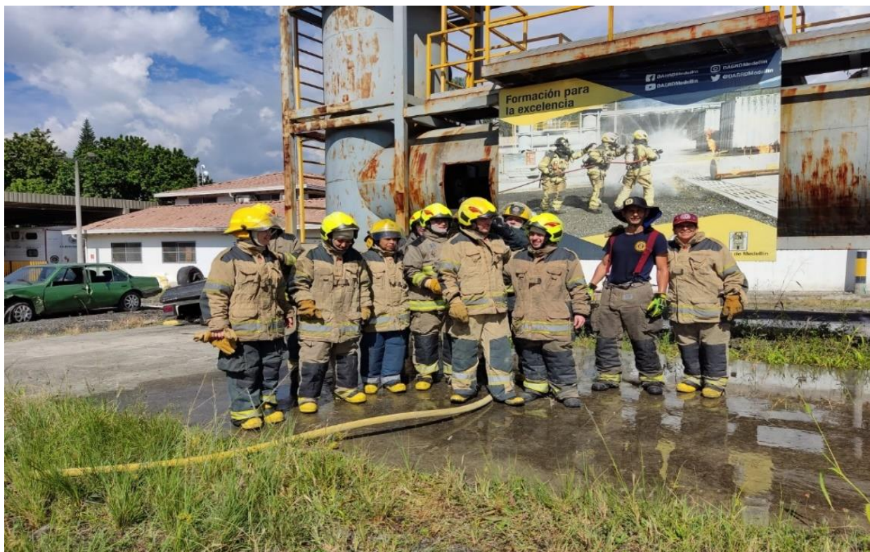
Ilustración 1. Capacitación bomberos por un día.

tiene una concurrencia muy alta y las instalaciones actualmente no cuenta con un plan de acción frente a las necesidades de acceso de la población con discapacidad, una mayor acción para el destino de recursos económicos, tecnológicos, y de mantenimiento de la infraestructura del museo.